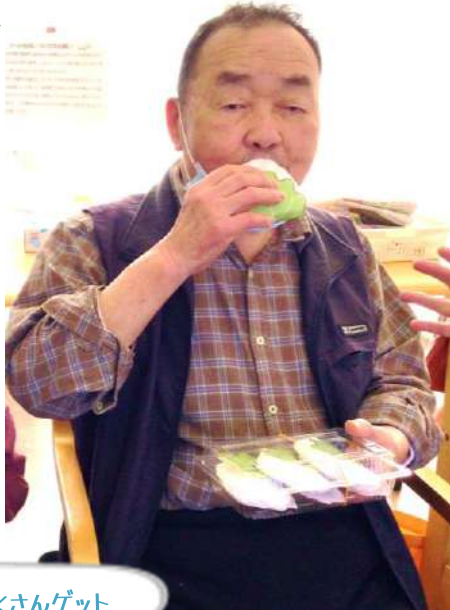
かしわもちたくさんゲット

デイサービスのゲームはリアルテイを求めているわけじゃないですが、かなりリアルな道具を使ってみなさんに楽しんでもらっています。「おいしそうやねえ」「食べてもええけ？」そんな声も聞こえてきておりました。楽しんで、目で見て楽しい。会話のきっかけにもなります☆