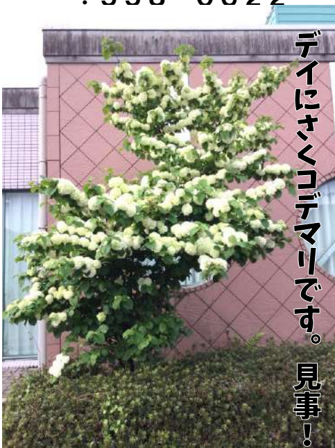
デイにさくコデマリです。見事！