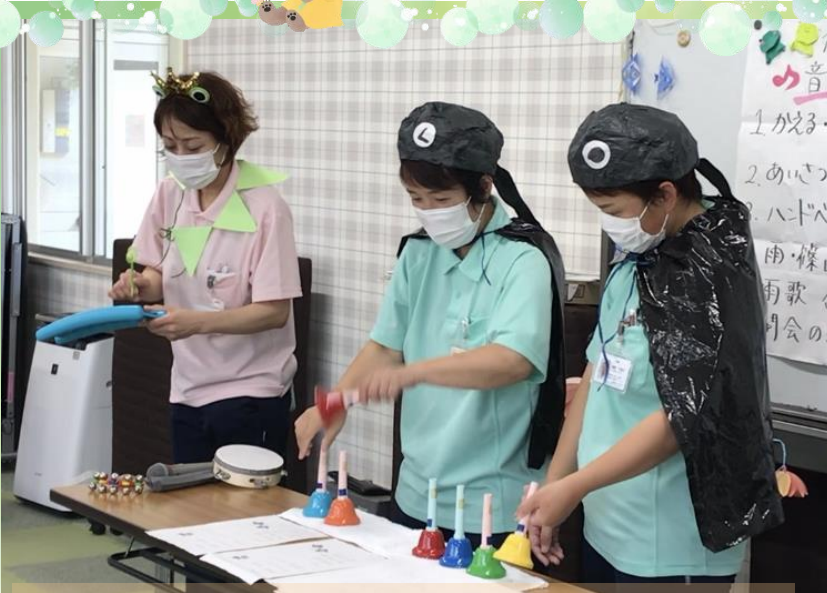
オタマジャクシに蛙がハンドベルの演奏をしました。