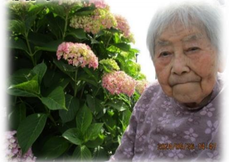
施設内には手作りの紫陽花もあります。