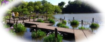
職員が別日に撮影してきました。