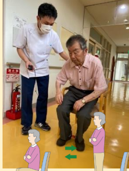
15回未満:転倒リスクが高くなる

三十秒の間に椅子から何回立ち上がりができるのかで評価します。十五回未満で転倒リスクが高い。