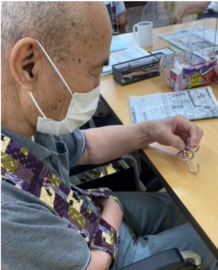
知恵の輪に挑戦されているところです。「お見事！」片手で上手に外されました。