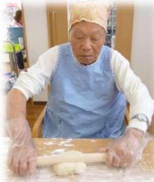
③ 捏ねて 伸ばして

今年も、うどん作りに挑戦しました。事業所では、四国出身のご利用者が多く、毎年恒例の行事となっています。生地を踏む作業、捏ねて伸ばす作業、切る作業、全てご利用者が頑張ってくれました。味の感想はそれぞれでしたが・・・今日しか味わえない特別なうどんができました。