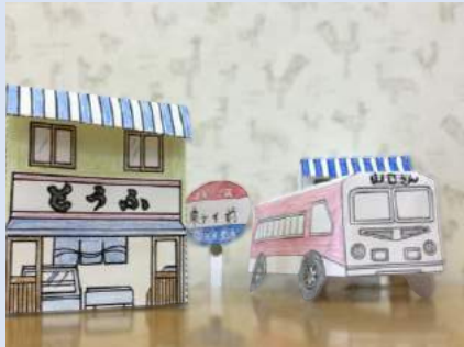
ミニチュアで広がる昔懐かしい風景。面白い作品が出来上がりました。昔話に花を咲かせます。