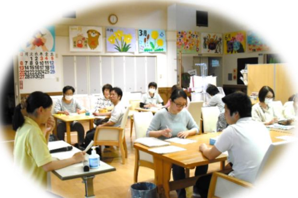
百寿の郷・福の郷との合同研修

食中毒予防の職員研修を 行いました。 梅雨の時期は食中毒に もっとも注意しなければ なりません。 細菌をつけない ふやさない やっつける 食中毒予防の基本です。